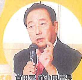
倉田薫 前池田市長