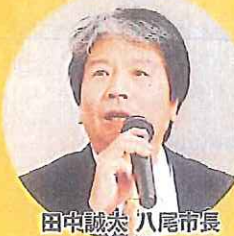
田中誠太 八尾市長

大阪の風土が多くの人と文化を育ててきた。その土壌を大切に、そして豊かに耕し、育てていくのは私たち府民。都構想ではないもう一つの大阪の未来を府民のちからで実現していくために新たな一歩が踏み出された。